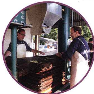
Préparation de la motte, pressage et évacuation du marc