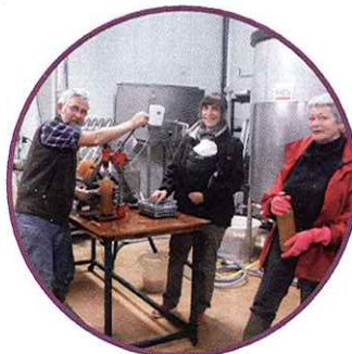
Pasteurisation, embouteillage à chaud, capsulage