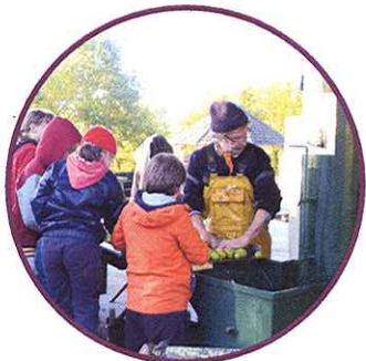
Déchargement et tri des fruits

La durée de l'activité est variable selon la quantité de jus produite, prévoyez une 1/2 journée pour être tranquilles !