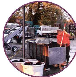
Rangement des bouteilles, nettoyage de l'atelier